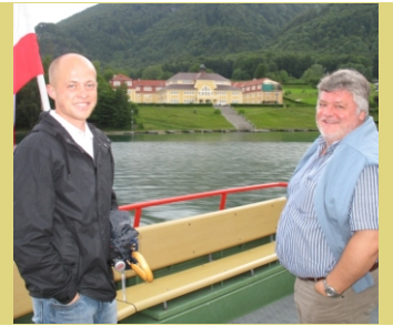
Abendprogramm: Bootsfahrt von St. Gilgen nach St. Wolfgang